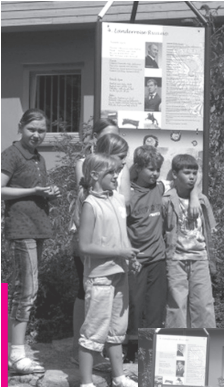
Die Grundschüler vor der von ihnen gestalteten Stele „Russland“.

Das Projekt „Länderreisen“ wird vom Projekt „Soziale Stadt“ und dem Sozialreferat der Stadt Würzburg, dem Bezirk Unterfranken und dem Kulturfonds Bayern sowie der Grundschule Würzburg-Heuchelhof gefördert und unterstützt